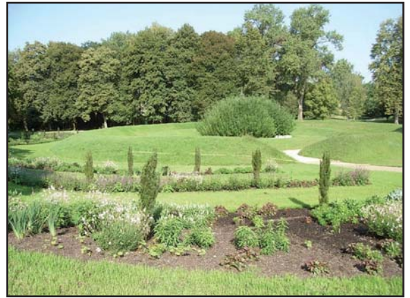
Der neue Meditationsgarten

Zu "Oberösterreichs meist besuchter Touristattraktion" entwickelte sich die Eurotherme Bad Schallerbach durch den Umbau der Therme und die Errichtung eines neuen Gesundheitszentrums, die Verbindung zum Atrium als Veranstaltungszentrum sowie nicht zuletzt durch den Bau des 4 Sterne-Hotels Paradiso, das sich zu einer echten Attraktion mit 100.000 Nächtigungen im Jahr 2008 als moderne touristische Resortanlage etabliert hat.