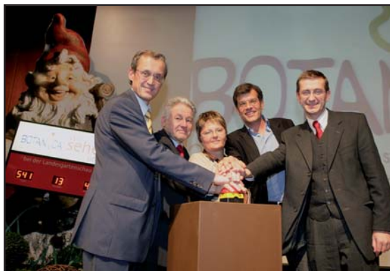
Auf Knopfdruck wurde der Countdown bis zur Eröffnung gestartet.